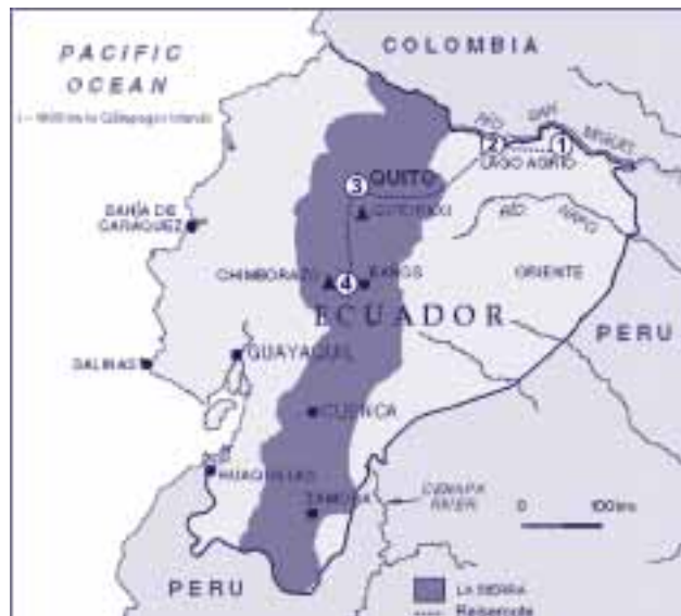
Reiseroute und Reiseziele in Ecuador: (1) Reserva Faunística Cuyabeno; (2) Ölstadt Lago Agrio, (3) Hauptstadt Quito, (4) Andendorf Salinas.

Zusätzlich ist dieses Gebiet von einer starken Zersiedelung, teilweise auch Urbanisierung um die großen Städte (z.B. Quito, Cuenca, Ambato) gekennzeichnet. Der technische Umweltschutz (Kläranlagen, Katalysatoren, Müllabfuhr) weist auch in den urbanisierten Gegen-