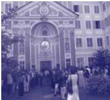
The XII LSP-Symposia was held at the Priester Seminar of Brixen/Bressanone, Italy

Inaugurated in Vienna in 1977, the biennial LSP Symposia represent one of the most awaited milestones in Applied Linguistics. The Symposia, supported by the AILA Scientific Commission on Language for Special Purposes, are organised in turn by different universities or research institutes of Europe and aim at promoting the varied activities of LSP studies. And thanks to the growing importance and recognition such studies are gaining worldwide, it is probably not too hazardous to claim that the echo of LSP Symposia is bound to spread far beyond the borders of our old continent.