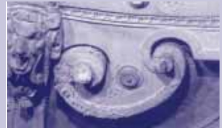
Starke Salzausblühungen an Architekturdetails

ist oben schon angeklungen, daß z.B. Fußbodenheizungen für stationäres Heizen auf eine konstante Temperatur am besten geeignet sind, während sich eine Bankheizung, die ja nur lokal wirkt und deren Betrieb teuer ist, vor allem für Heizen während der Gottesdienste anbietet. Luftheizungen werden sowohl durchgehend als auch stoßweise betrieben und bieten durch ihre Regelbarkeit zudem die Möglichkeit, durchgehend eine bestimmte Grundtemperatur zu halten und die Temperatur vor Gottesdiensten langsam zu erhöhen, so daß keine großen Luftströmungen entstehen.