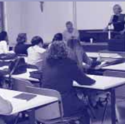
Una sessione del XII Simposio Europeo sulle lingue speciali organizzato dall'Accademia Europea di Bolzano

Chi di noi non ha visto, almeno una volta, le sue gioie per l'acquisto della telecamera nipponica a lungo concupita infrangersi contro un manuale d'istruzioni che oppone resistenza? Nel migliore dei casi il manuale è