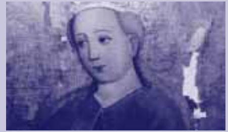
Direkt beströmte Altartafel mit starker Ablösung der Malsicht

Mit allen drei Heizungstypen kann eine Kirche grundsätzlich durchgeheizt oder stoßweise erwärmt werden. Allerdings